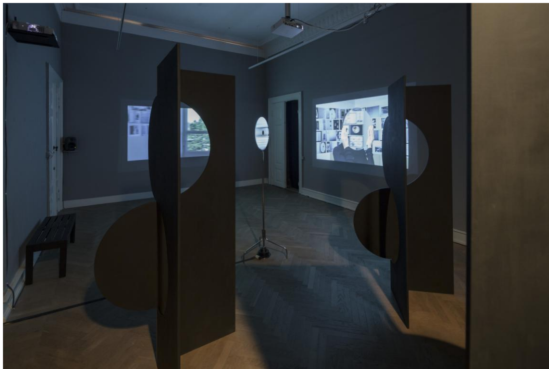
Installation view, Pia Rönicke. Foto: Anders Sune Berg

D. 5. juni 1915 fik kvinder valgret i Danmark. I 2015 markerede Museet for Samtidskunst denne skelsættende begivenhed med udstillingen KVINDER FREM!